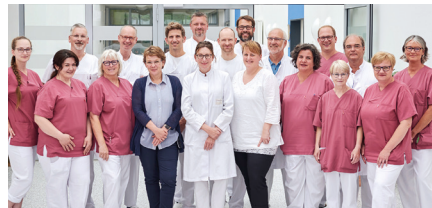
3. Medizinische Klinik