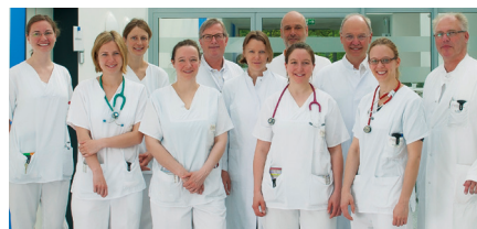
Klinik für Kinder- und Jugendmedizin