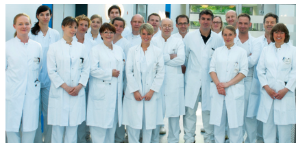
Klinik für Chirurgie