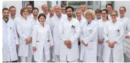
2. Medizinische Klinik