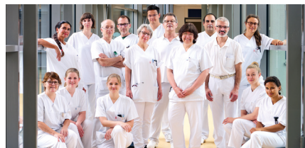
Klinik für Chirurgie