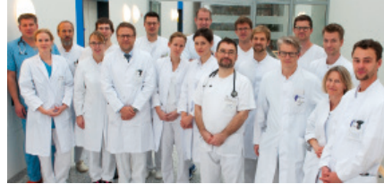
1. Medizinische Klinik