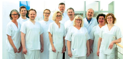
3. Medizinische Klinik