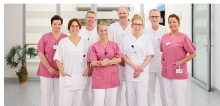
Klinik für Kinder- und Jugendmedizin